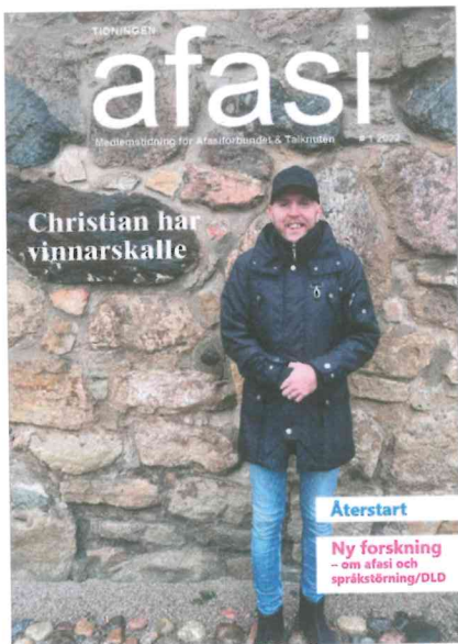
Omslagsbild Christian Kjellman